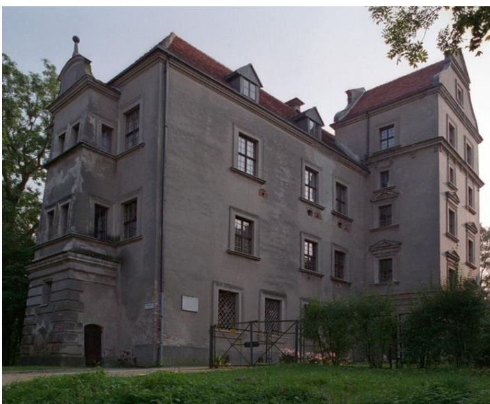
Fot. Stary Zamek w Płotach

TRASA PIESZA: PKP Gryfice (przyjazd ok. godz. 08.09) – kościół pw. Wniebowzięcia NMP – ul. Strzelecka – Park Miejski – ul. Spacerowa – użytek ekologiczny „Źródliskowe Wąwozy koło Kocierza” – Kocierz – rezerwat przyrody „Rzeka Rekowa” – ruiny mostu na rzece Rekowa – Płoty ( - Park Zamkowy - Kościół pw. Przemienienia Pańskiego – Nowy Zamek – Stary Zamek ) - PKP Płoty (23 km).