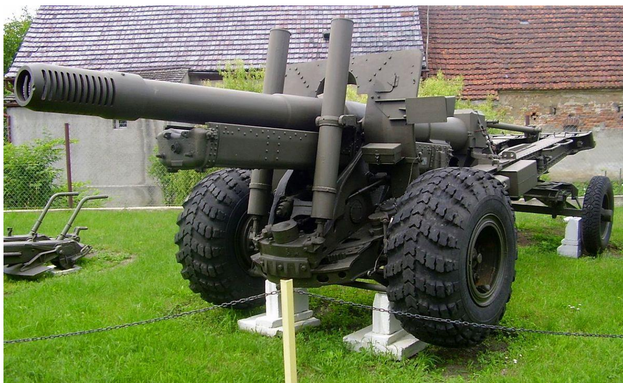
Haubicoarmata wz. 37

20.03.2022 r. (niedziela) – Puszcza Bukowa